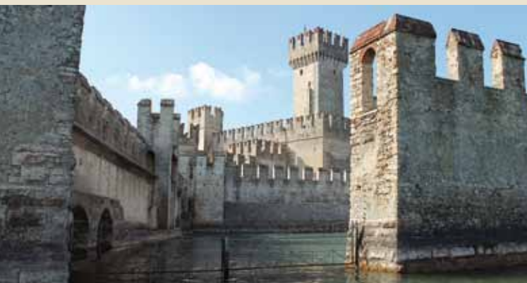
2. Entrada a la dársena desde el lago

Desde el portal, antiguamente protegido también por un rastrillo, se accede a un pórtico donde están la taquilla, unos paneles explicativos y tres piraguas altomedievales de madera, halladas en las aguas del río Oglio por un equipo de arqueólogos del Centro di Archeologia Subacquea - STAS (Centro de Arqueología Subacuática), que, durante años, tuvo su sede en el interior del castillo.