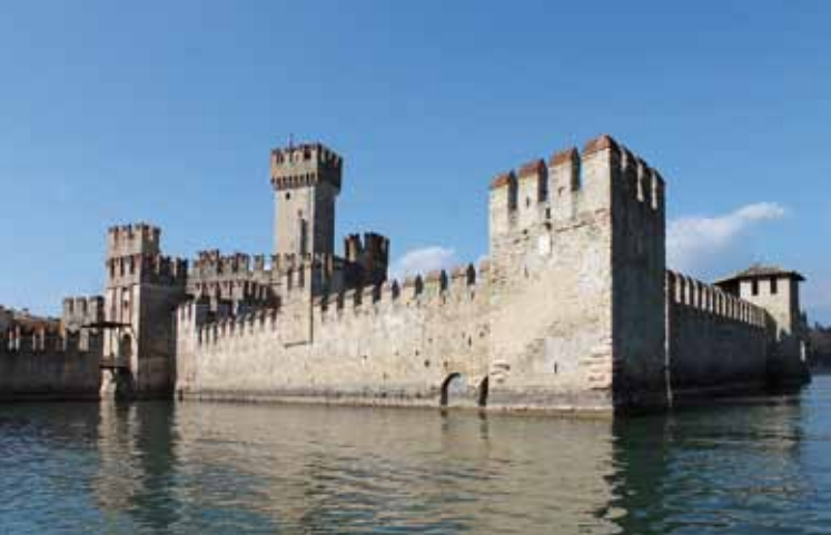
1. Vista desde el lago