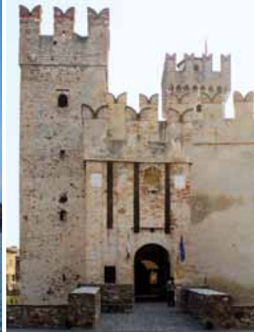
3. Entrée depuis piazza Castello