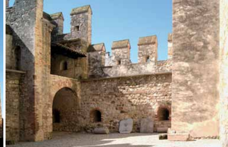
6. La seconde cour