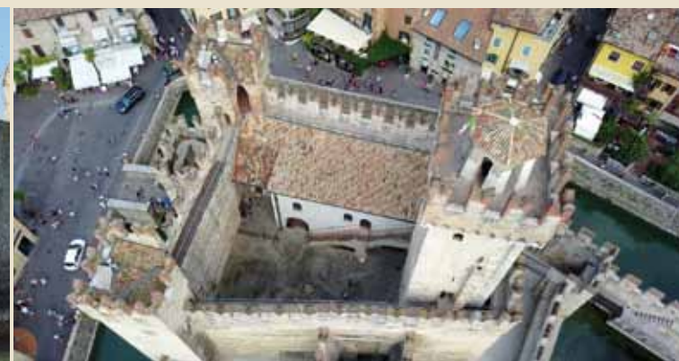
5. La baille