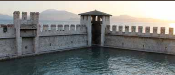
8. La darse

La darse a la forme d'un trapèze irrégulier et l'inclinaison du mur extérieur pourrait avoir servi de précaution pour protéger le bassin d'eau contre le vent du Nord, le «pelèr». Deux chemins de ronde la longent des trois côtés : la partie supérieure pour la défense des milices et la partie inférieure pour le mouillage des bateaux. Le bassin à l'intérieur de la darse - enterré par l'accumulation de débris au cours des siècles et devenu durant le XIX e siècle une cour piétonne - est déterré en 1919 pour accueillir à nouveau l'eau du lac à l'intérieur. En 2018, suite à une restauration qui a également conduit à la construction d'un escalier dans la tour nord-est, la darse a finalement été ouverte au public.