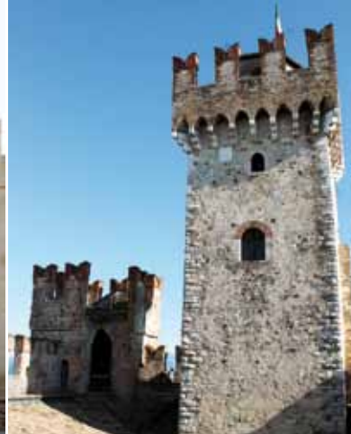
4. Le donjon