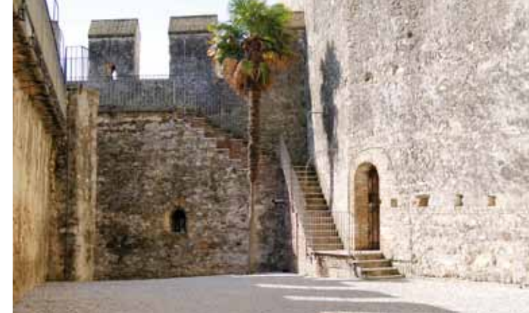
7. חצר המעגן

www.beniculturali.it >luoghi della cultura >agevolazioni