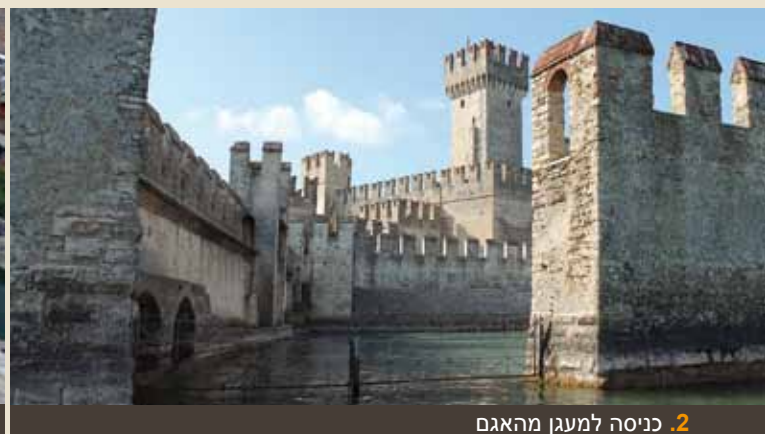
2. כינסה למעגן מהאגם