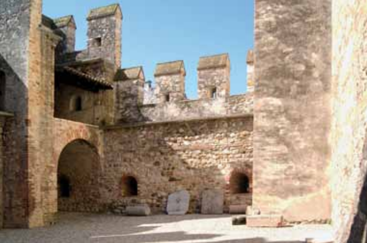
6. החצר השניה