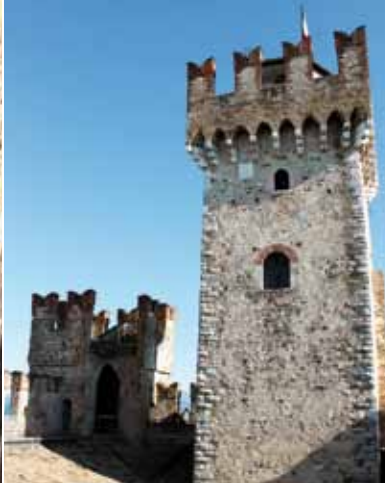
4. המגדל הראשי