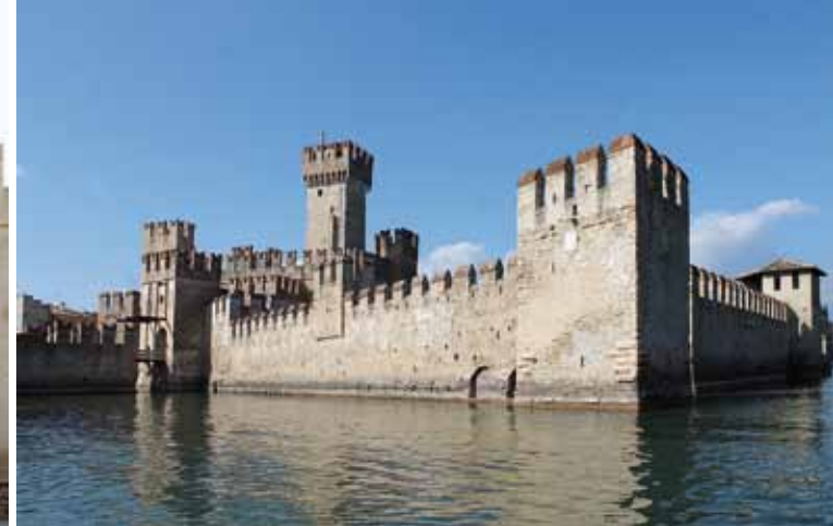
1. מבט מהאגם

המגדל הראשי – הצד הדרומי של הטיילת מוביל אל המגדל הראשי: גובהו 73 מטר והוא מעוטר במדפי אבן דקורטיביים ובשלט אצולה של משפחת דלה סקאלה. השלט נשא במקור את סמל הסולם אך הוא הושמד מאוחר יותר מאחר וכל שליט חדש נהג למחוק את זכר קודמו - בראש ובראשונה ע"י העלמת סמליו. שינוי-החומה של המגדל הראשי נבנו כולן מחדש במלאכת ה שיקום של 1920 לערך, אך משערים שבבסיסו של מעקה האבן היו פעם פתחים ("מְשִׁיקוּלִי") שדרכם השליכו מיני חומרים וקלעים על התוקפים. מראש המגדל ניתן להנות מהנוף הקסום של אגם גארדה.