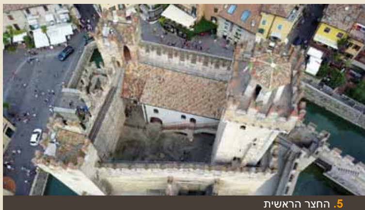
5. החצר הראשית

טיילת החומות הבנויה מאבן-ורונה והיום מאובטחת ע"י מעקים, מקיפה את החצר הראשית מארבעת צדדיה ועוברת דרך שלושת המגדלים הפינתיים. כאן זכו החיילים להגנה מפני האוייב הודות לשינוי-החומה שמביניהן היו יורים קלעים.