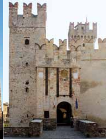
3. כינסה מיכר המצודה – Piazza Castello